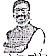
हेमंत सोरेन मुख्य मंत्री