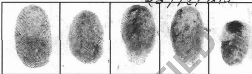
अंगूठा तर्जी मध्यमा अनामिका कनिष्ठ