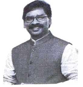
श्री हेमंत सोरेन माननीय माननीय मुख्यमंत्री