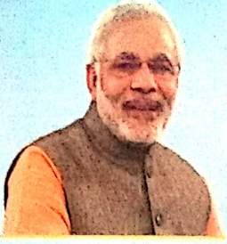
श्री नरेंद्र मोदी माननीय प्रधानमंत्री